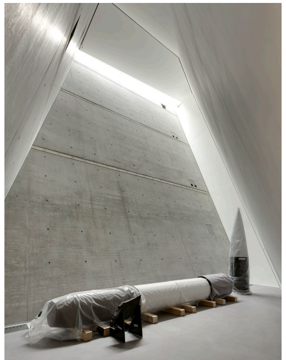
Impressionen der Ausstellung ©Holzer Kobler Architekturen / Jan Bitter

Die Ausstellung geht in ihrer Architektur sowohl eine Symbiose mit dem klassizistischen Altbau als auch dem keilförmigen Neubau von Daniel Libeskind ein: Die Chronologie im Altbau zeigt als Zeitschiene strukturiert die Geschichte des deutschen Militärs. Im Raum mäandrierende Vitrinen präsentieren ausgewählte historische Objekte wie in Schaufenstern. Der Themenparcours im Neubau hingegen will den Besucher emotional berühren. Die Ausstellung behandelt epochenübergreifend einzelne Aspekte und Phänomene des Militärs, welche die Gesellschaft nachhaltig beeinflussen. In begehbaren Rauminstallationen werden die thematischen Inhalte wirkungsvoll in assoziative Bilder übersetzt. Die ganz selbstverständlich wirkende Symbiose aus Raum-Ausstellung-Objekte schafft eine einzigartige Museumsarchitektur und Darstellung der Geschichte des Militärs als Teil unserer Kultur. Als zusätzliche Bildebene verknüpfen zeitgenössische Medienkunstwerke Raum und Exponate.