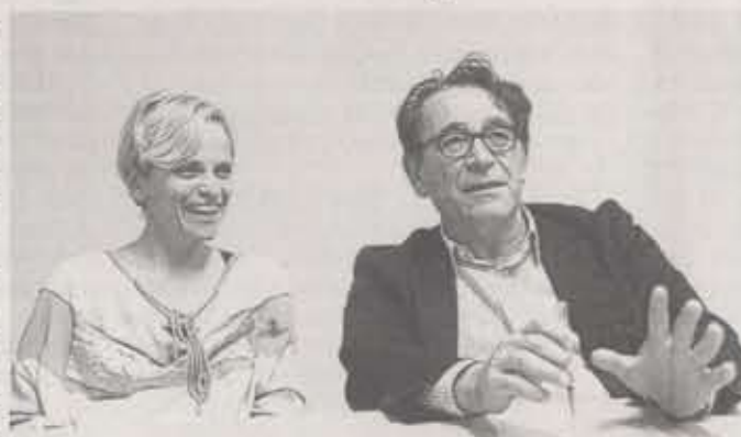
Aufgabe glücklich abgeschlossen: Barbara Holzer und HG Merz.

Auch die Beschriftung von mehreren tausend räumlich-geometrisch völlig verschiedenartigen Exponaten ist eine